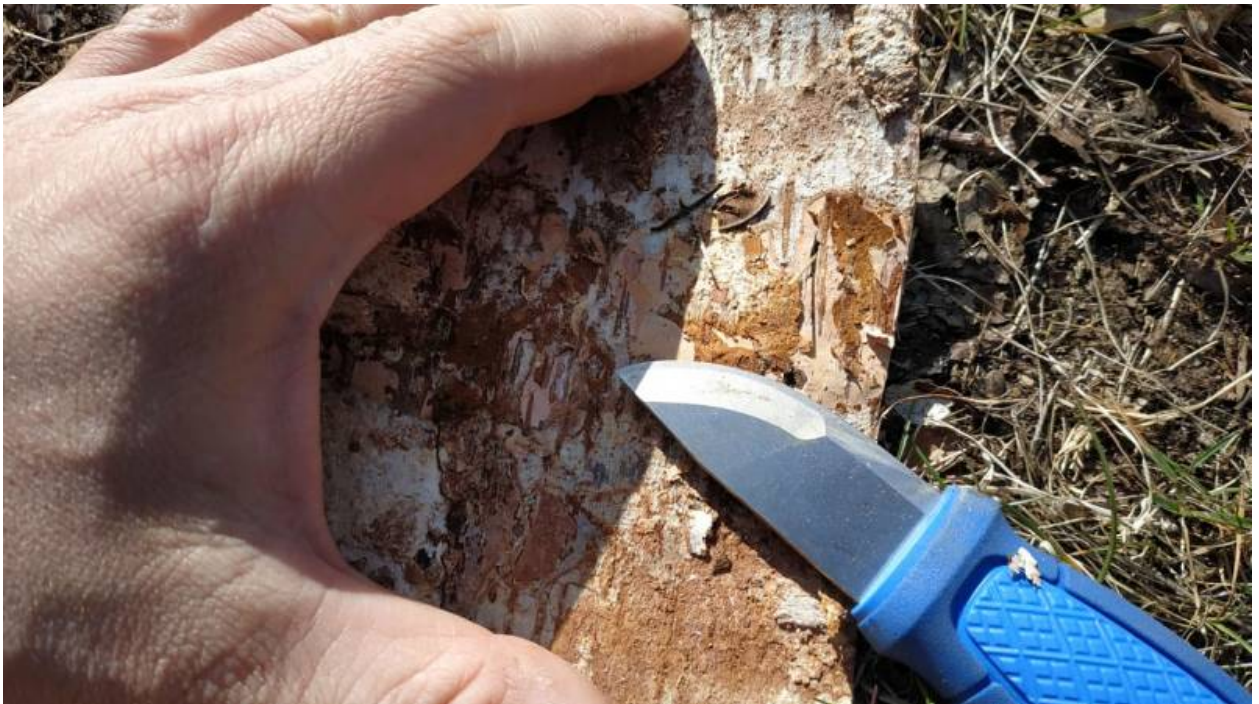
Mit dem Messer säuberst du die Rinde

Danach säuberst du die Rinde mit deinem Messer oder mit der Schneide deiner Axt. Versuche so gut es geht die Rinde zu glätten. Je glatter, desto besser rollt sich die Rinde dann zusammen.