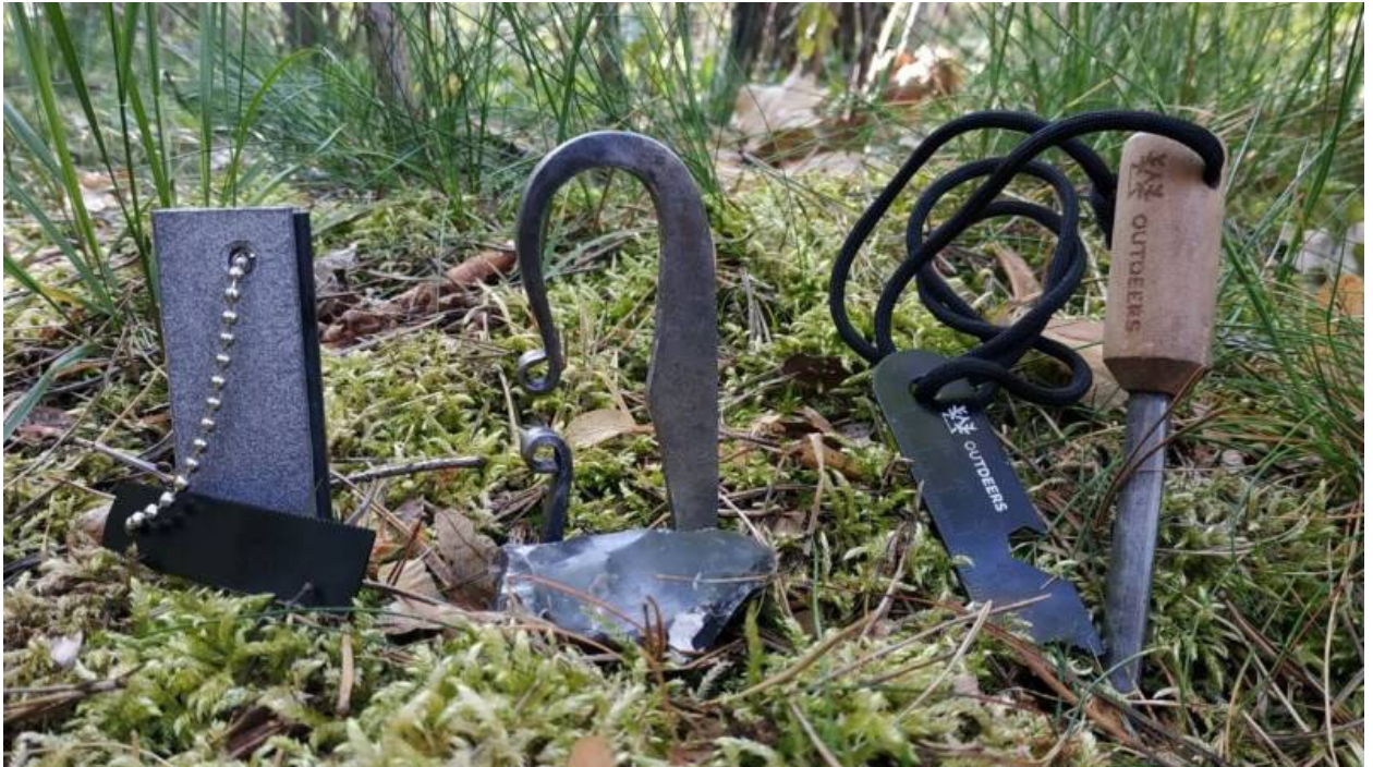
Verschiedene Methode zum Anzünden eines Feuers

Auf dem Bild siehst du verschiedene Anzünder. Gehen wir sie kurz durch.