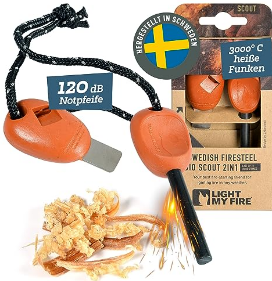
Original Feuerstahl Light My Fire Scout