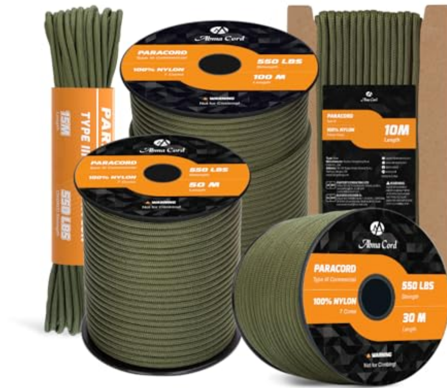
Paracord 550er für Bushcraft