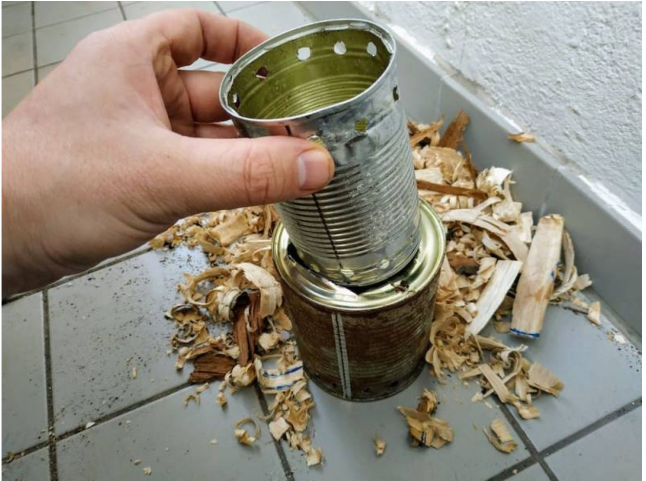
Eigenbau Holzvergaser beim Zusammenbau

Die erste Brennkammer, das Innere des Ofens, enthält Holz als Brennmaterial. In dem äußeren Hohlraum der doppelten Wand steigt Sauerstoff auf und es erfolgt eine Zweitverbrennung der Holzgase (und dem Rauch) am Ausgang der Luftlöcher.