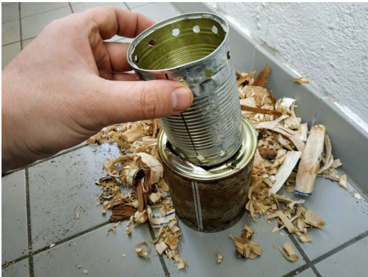
Eigenbau Holzvergaser beim Zusammenbau

Die erste Brennkammer, das Innere des Ofens, enthält Holz als Brennmaterial. In dem äußeren Hohlraum der doppelten Wand steigt Sauerstoff auf und es erfolgt eine Zweitverbrennung der Holzgase (und dem Rauch) am Ausgang der Luftlöcher.