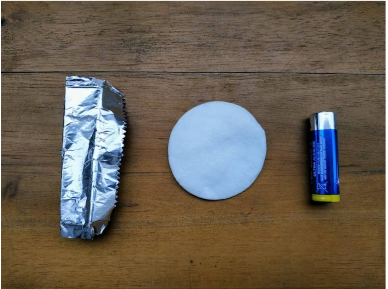
Batterie, Watte, Kaugummipapier