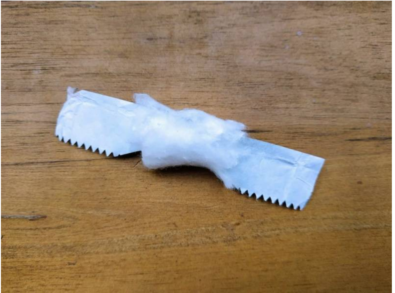
Watte um Alufolie