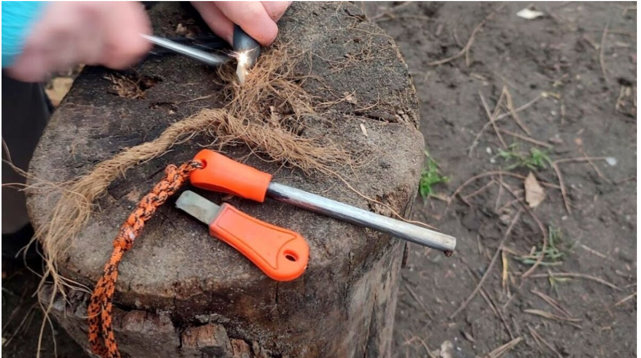
Der Sir Vivor Profi Outdoor Feuerstahl XL