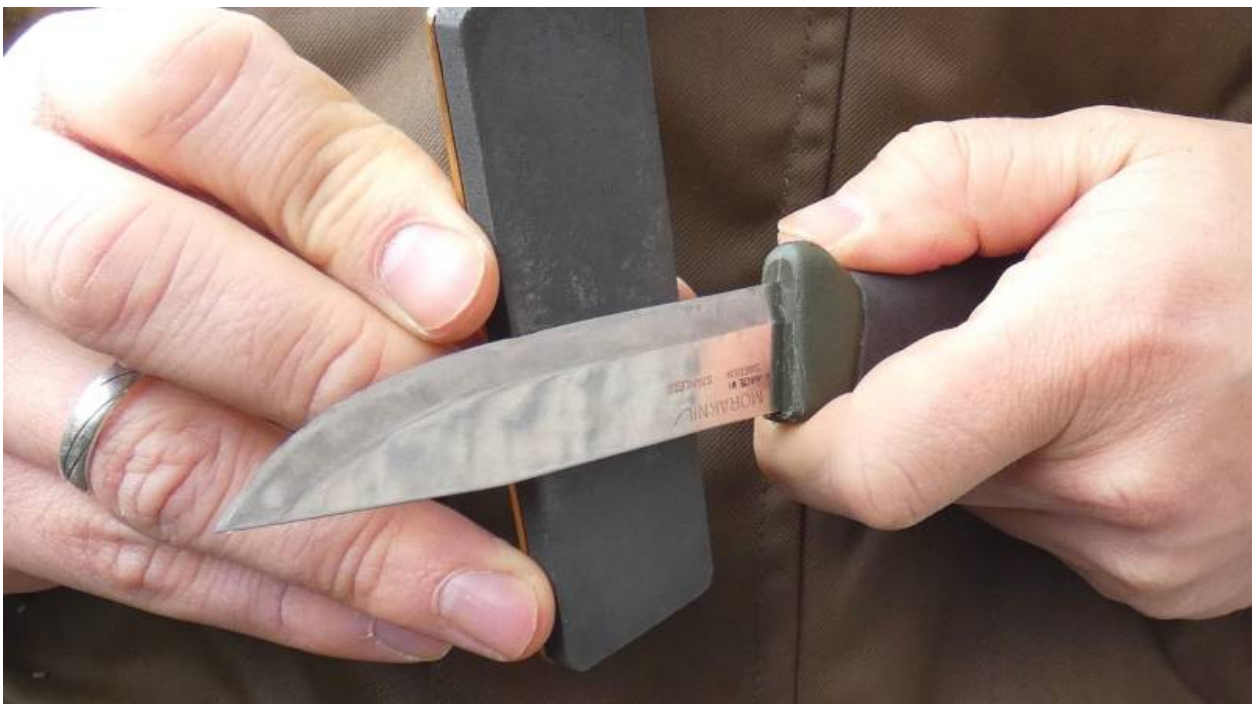
Den Fallkniven DC4 Schleifstein habe ich immer im Gepäck