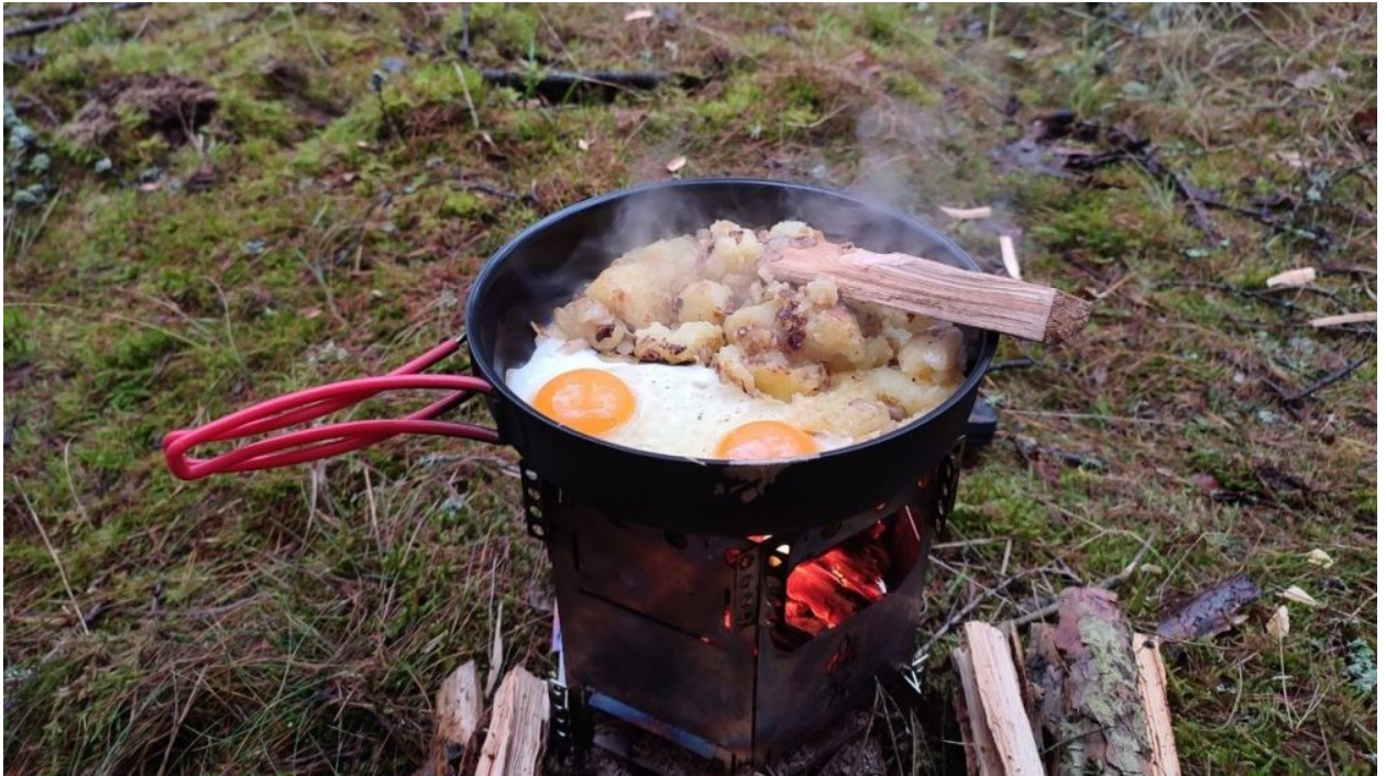
Mein Mittagessen auf dem Wika FlexFire Premium Hobo mit der Primus Litech Bratpfanne aus Aluminium