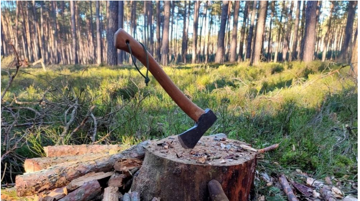
Das Hultafors Trekkingbeil HULTAN