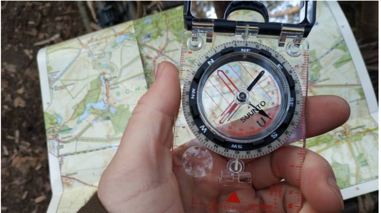
Der Suunto Kompass MC-2