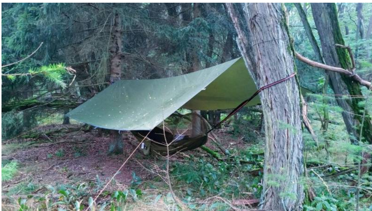
Das Unigear Tarp 3 x 4 Meter im Einsatz im Wald mit Hängematte

Günstig und zuverlässig ist das Unigear Tarp meine Empfehlung für Beginner. Das Tarp ist ein gelungenen Kompromiss zwischen Robustheit, Leichtigkeit und Flexibilität.