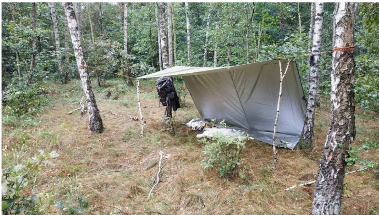
Ein Tarp aus Nylon ist perfekt für den Einstieg

Die meisten günstigen Tarps sind aus Nylon, weil Nylon günstig in der Herstellung ist und es zudem elastisch und wasserfest ist. Beachte aber, dass sich Nylon ausdehnt, wenn es nass wird und sich wieder zusammenzieht beim Trocknen.