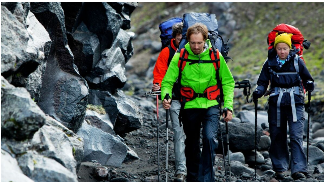
Beim Trekking und langen Wanderungen solltest du unbedingt auf sehr leichte Tarps setzen

Dickere Tarps sind auch stabiler als dünne Tarps. Der Nachteil ist ganz eindeutig das Gewicht. Dickere Tarps wiegen auch mehr und sind fürs Ultra-Leicht-Trekking hinderlich.