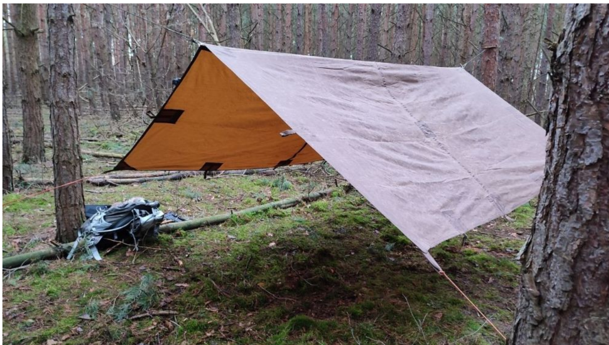
Der Tarp Aufbau flying A-frame – gute Sicht und nah an der Natur, aber den Elementen ausgesetzt

Tarps sind außerdem wasserdicht und bieten einen hervorragenden Sonnen- und Regenschutz. Sie sind eine gute Ergänzung zu jeder Campingausrüstung und das Packmaß spielt in der Regel keine Rolle.