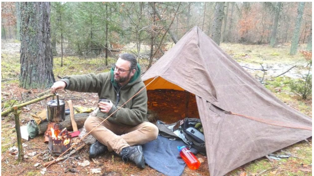
Mein selbstgenähtes Tarp aus Oilskin (100 % Baumwolle)

Sollte für dich das Gewicht keine große Rolle spielen, so kann ein stabiles Baumwollmischgewebe sinnvoll sein. Besonders gut ist es für den Gebrauch in der Nähe von offenem Feuer oder im Sommer geeignet, da sich hier die Wärme nicht zu sehr aufstaut.