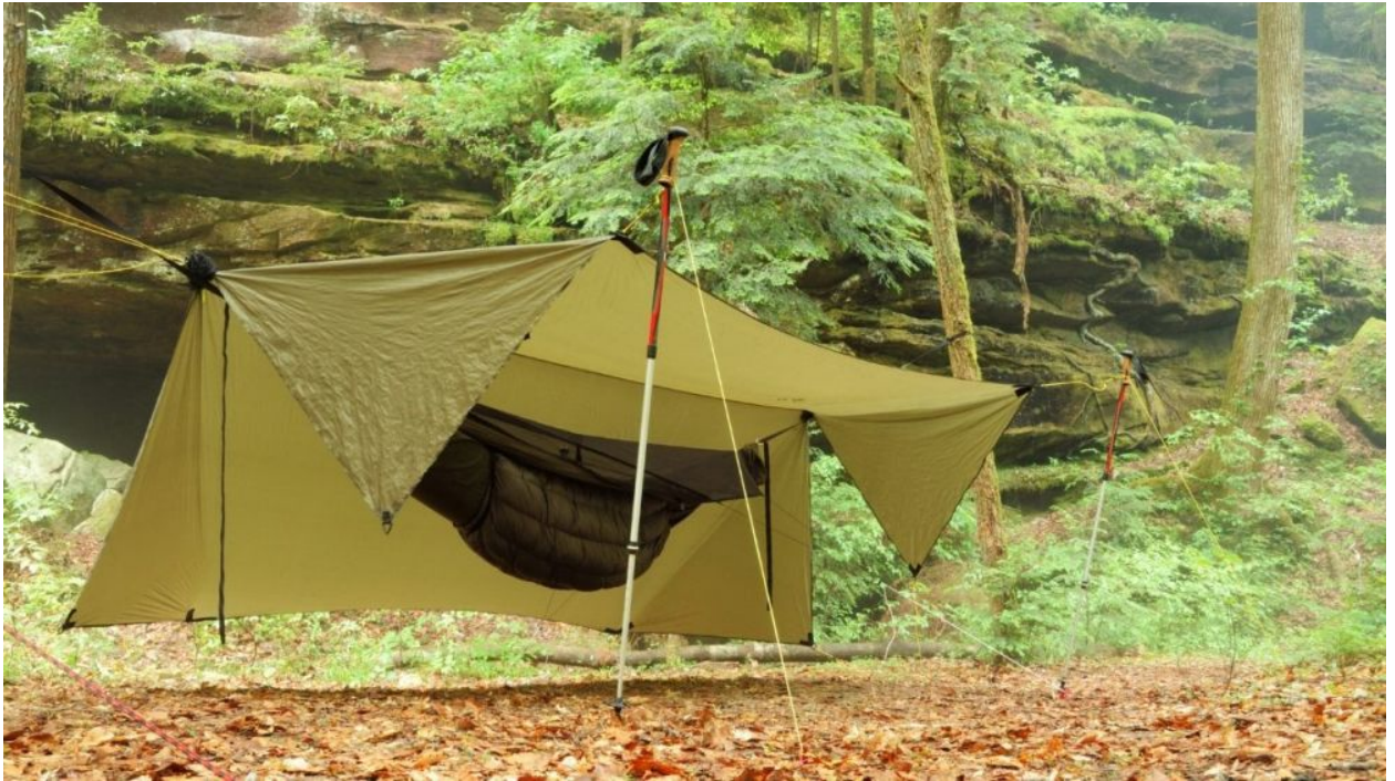
Ein Tarp mit Hängematte und Underquilt