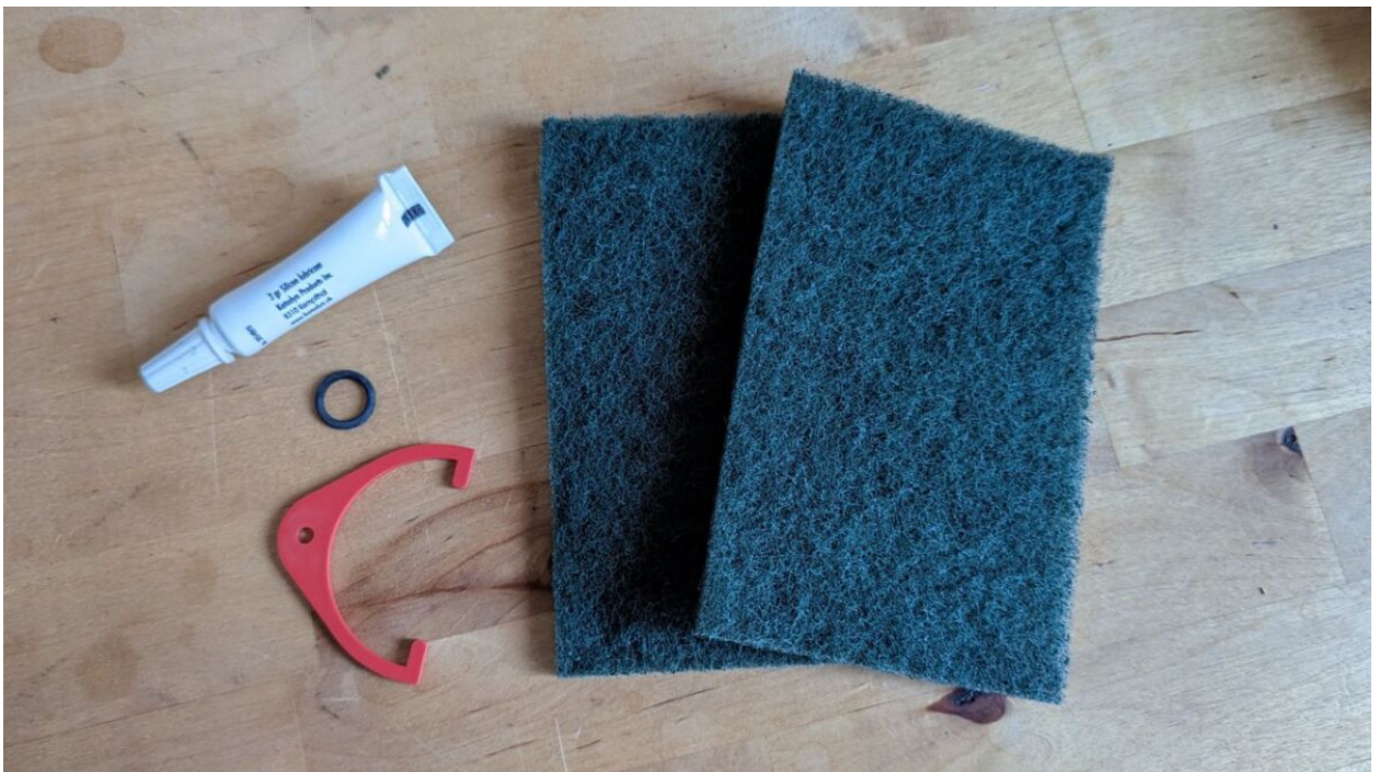
Schwämme und Zubehör erleichtern die Reinigung und Lebensdauer

Indem du deinen Katadyn Pocket Wasserfilter gut pflegst und regelmäßig wartest, stellst du sicher, dass er stets optimale Leistung erbringt und dich auf vielen Outdoor-Abenteuern begleitet.