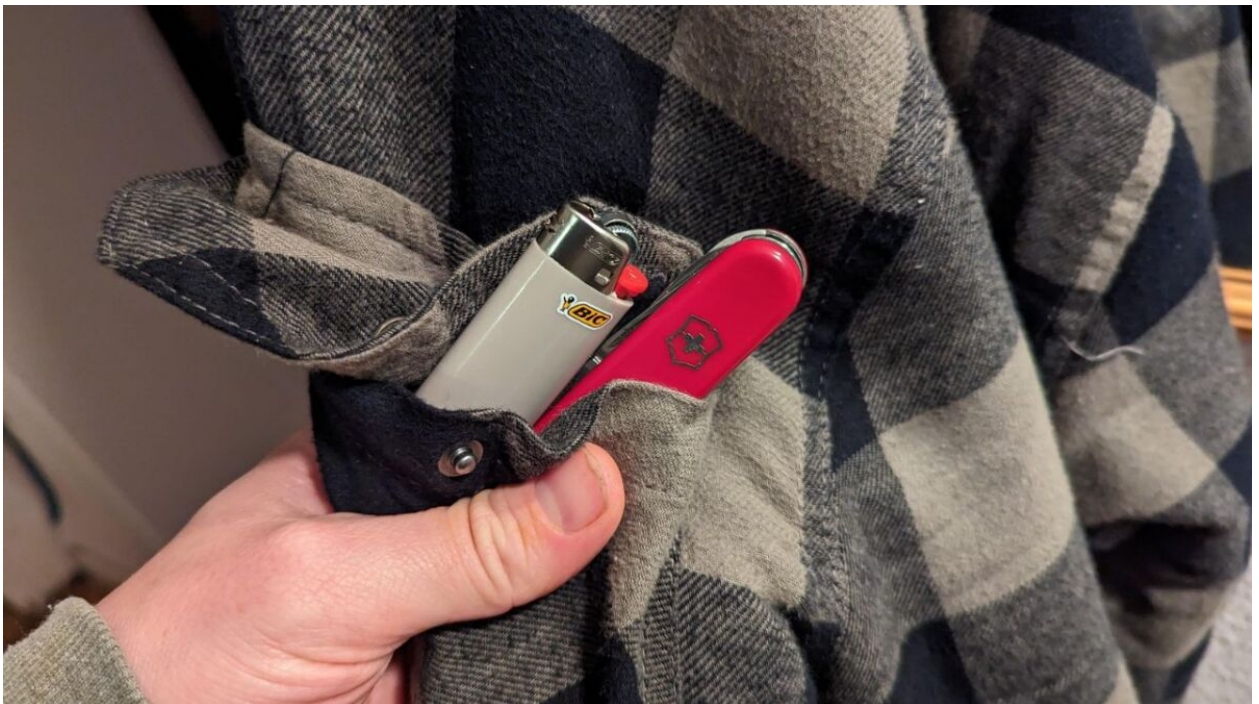
Habe ich immer dabei: Taschenmesser und Feuerzeug

Oftmals bieten die Hersteller auch eine Garantie oder eine begrenzte lebenslange Garantie auf ihre Produkte, die möglicherweise die Kosten der Reparatur abdeckt.