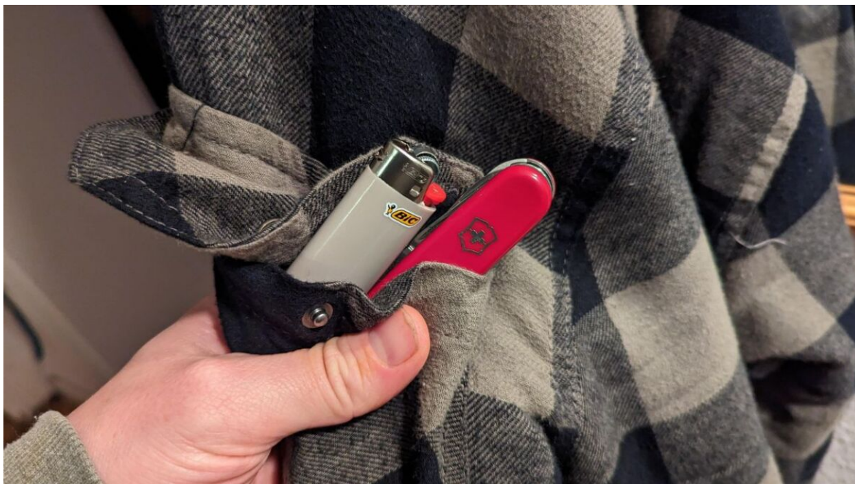
Habe ich immer dabei: Taschenmesser und Feuerzeug

Oftmals bieten die Hersteller auch eine Garantie oder eine begrenzte lebenslange Garantie auf ihre Produkte, die möglicherweise die Kosten der Reparatur abdeckt.