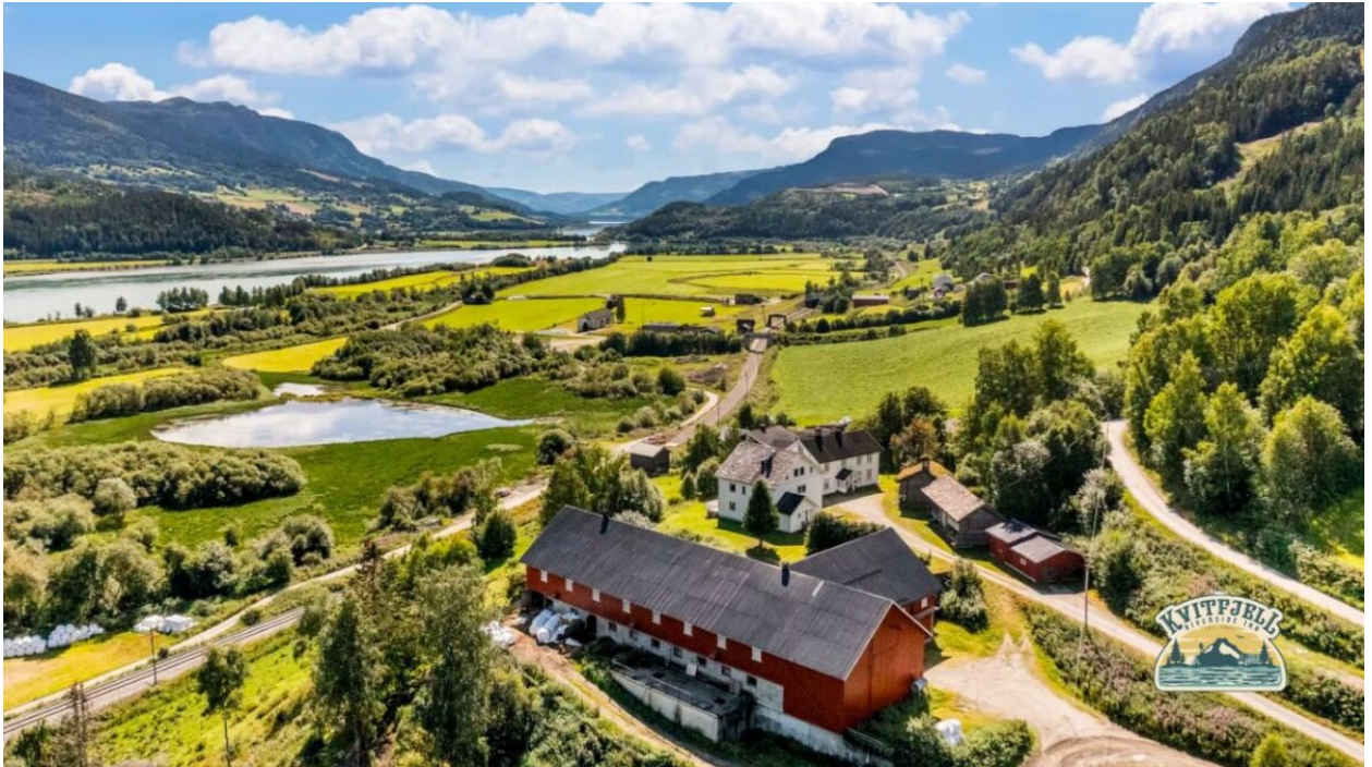
Ein Ausschnitt von dem riesigem Gelände in Norwegen

Ob du nun ein erfahrener Outdoor-Enthusiast bist, der seine Survival-Fähigkeiten auf die Probe stellen möchte, ein Bushcrafter bist, der werkeln will oder ein Künstler, der nach Inspiration in der Natur sucht - Kvitfjell Riverside Inn bietet für viele Menschen diesen Raum.