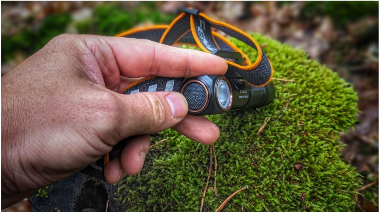
Der Aus-An-Schalter der FENIX HM61R v2.0

Magnetische Endkappe und Clip: Ein besonderes Feature der FENIX HM61R v2.0 ist die magnetische Endkappe. Du kannst die Stirnlampe einfach an einer metallischen Oberfläche befestigen und hast so beide Hände frei. Der Clip ermöglicht es dir, die Stirnlampe an deinem Rucksack oder Gürtel zu befestigen, wenn du sie gerade nicht brauchst.