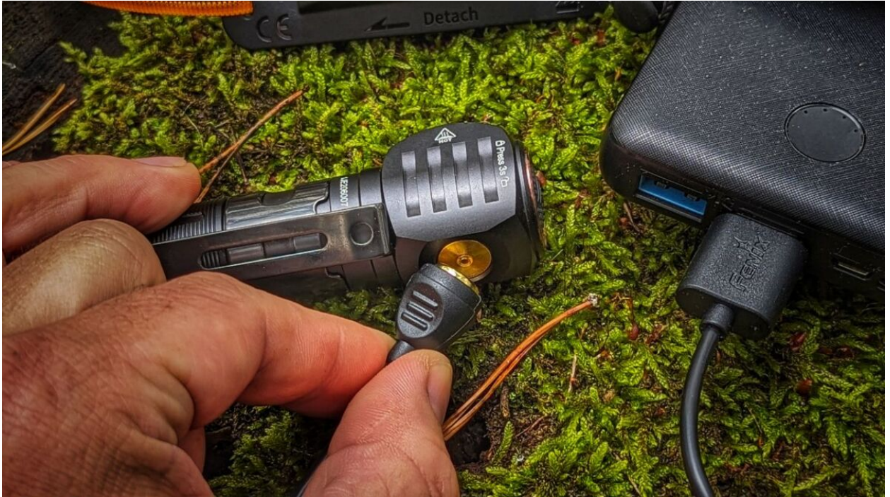
Keine fummeligen Stecker bei der FENIX HM61R v2.0