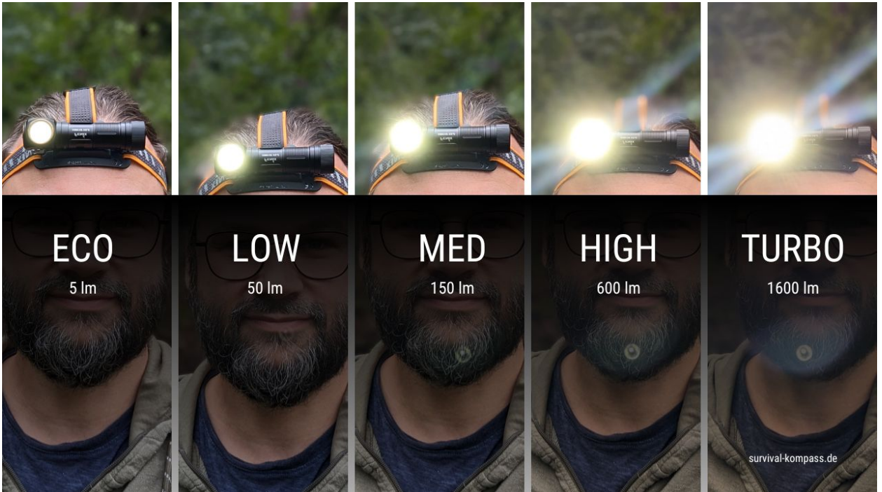
Alle Helligkeitsstufen auf einen Blick