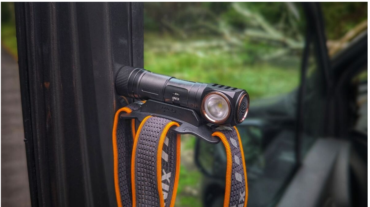
Hält fantastisch - die FENIX HM61R v2.0 mit magnetischer Halterung

Magnetische Endkappe und Clip: Ein besonderes Feature der FENIX HM61R v2.0 ist die magnetische Endkappe. Du kannst die Stirnlampe einfach an einer metallischen Oberfläche befestigen und hast so beide Hände frei. Der Clip ermöglicht es dir, die Stirnlampe an deinem Rucksack oder Gürtel zu befestigen, wenn du sie gerade nicht brauchst.