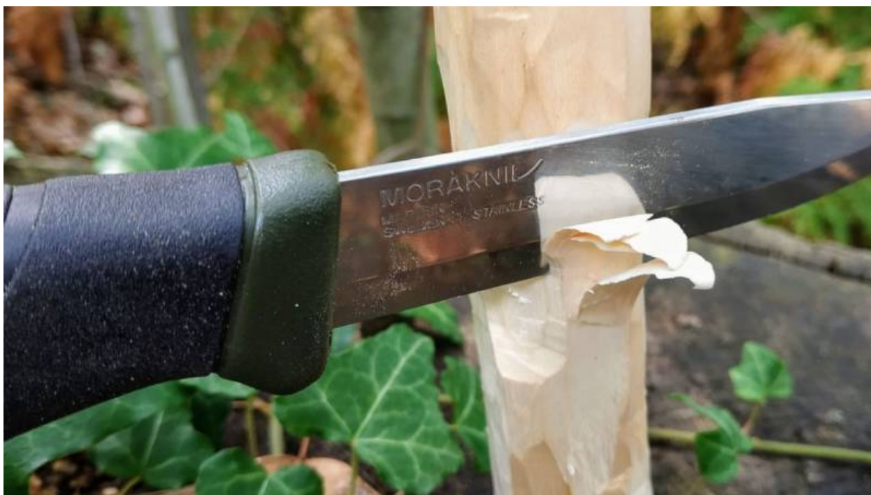
Ein Messer wird zum Schnitzen von Holz verwendet

Guter Rat: Achte auf Fotos in den Bewertungen. Manchmal zeigen Leute, wie das Messer nach einem Jahr Benutzung aussieht. Das ist super hilfreich!