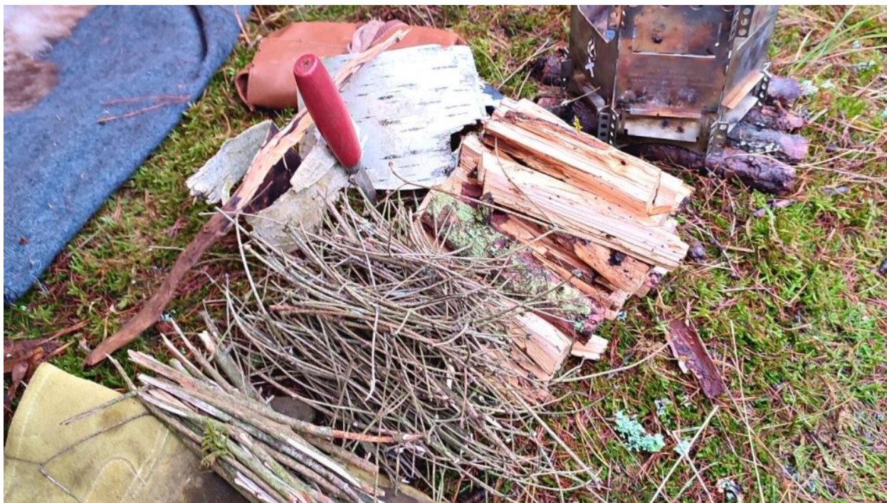
Jemand bereitet Holz für ein Feuer vor