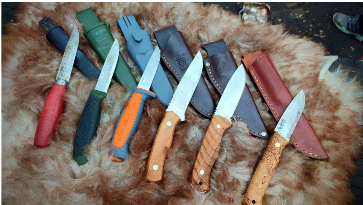
Verschiedene Buschmesser liegen nebeneinander