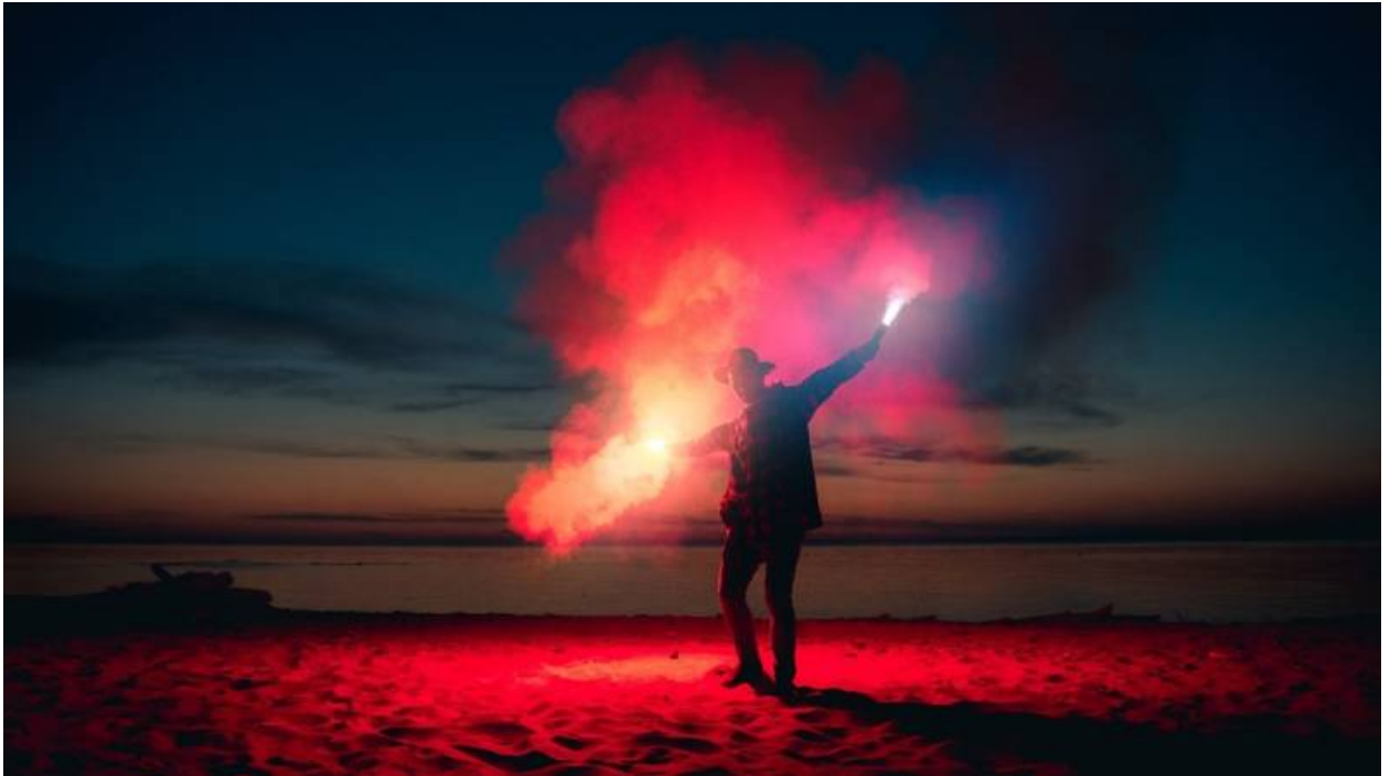
Rauchsignale zum Hilfe rufen