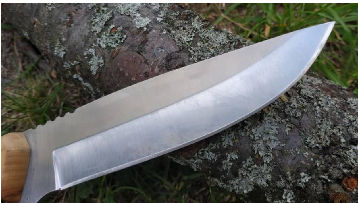
Eine Messerklinge - ist es der richtige Stahl für dich?

Es ist wie bei einem engen Freund. Du willst jemanden, der immer für dich da ist, besonders wenn du im Wald oder in den Bergen bist.