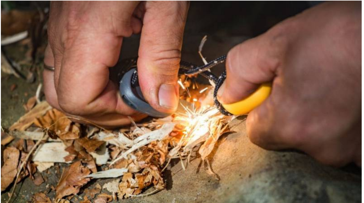
Ein Feuerstahl wird zum Feuer machen verwendet

Mach dir keine Sorgen, wenn es beim ersten Mal nicht klappt. Übung macht den Meister.