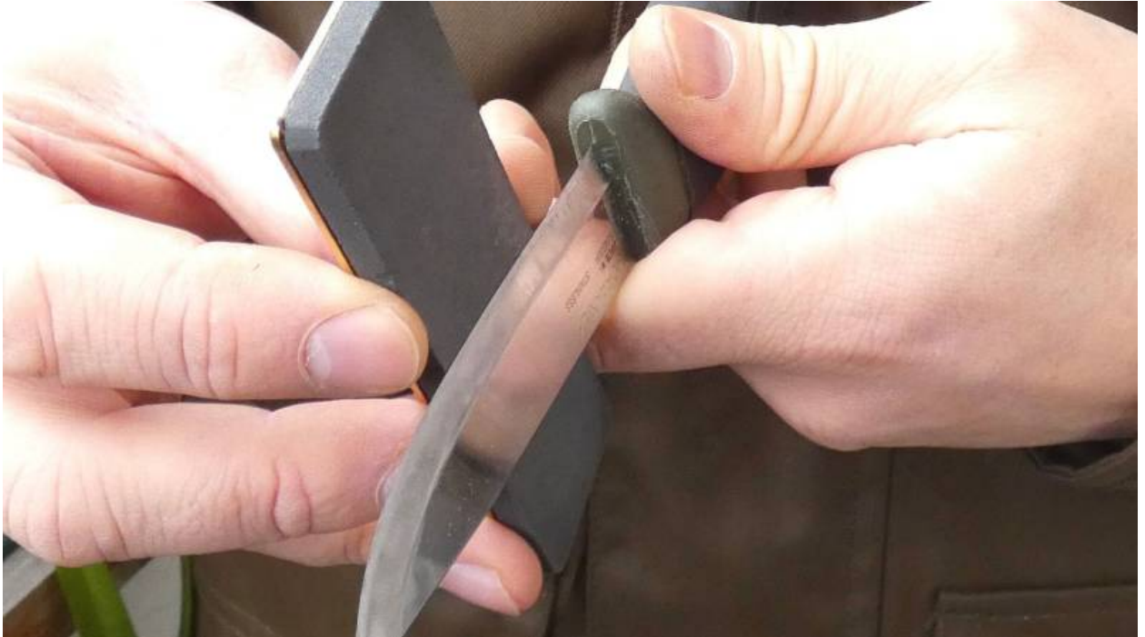
Messer wird auf einem Schleifstein geschärft