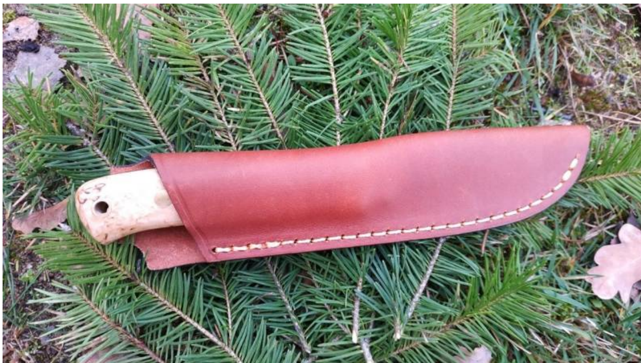
Ein Bushcraft-Messer in einer Lederscheide