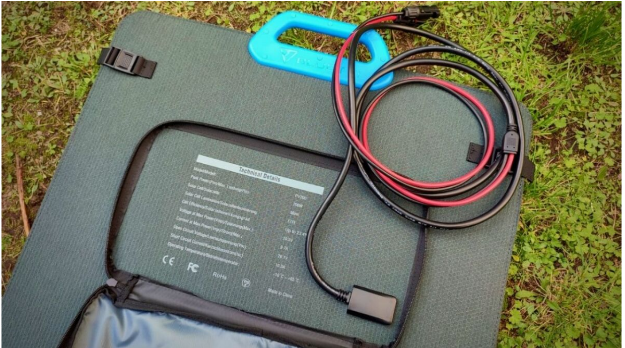
bluetti solarpanel SP200 kabel

Mit der AC200 L in der Wildnis zu sein, bedeutet, dass du nicht von Steckdosen abhängig bist. Du bist frei, solange draußen zu bleiben, wie du möchtest. Das ist nicht nur Energie – das ist Freiheit.