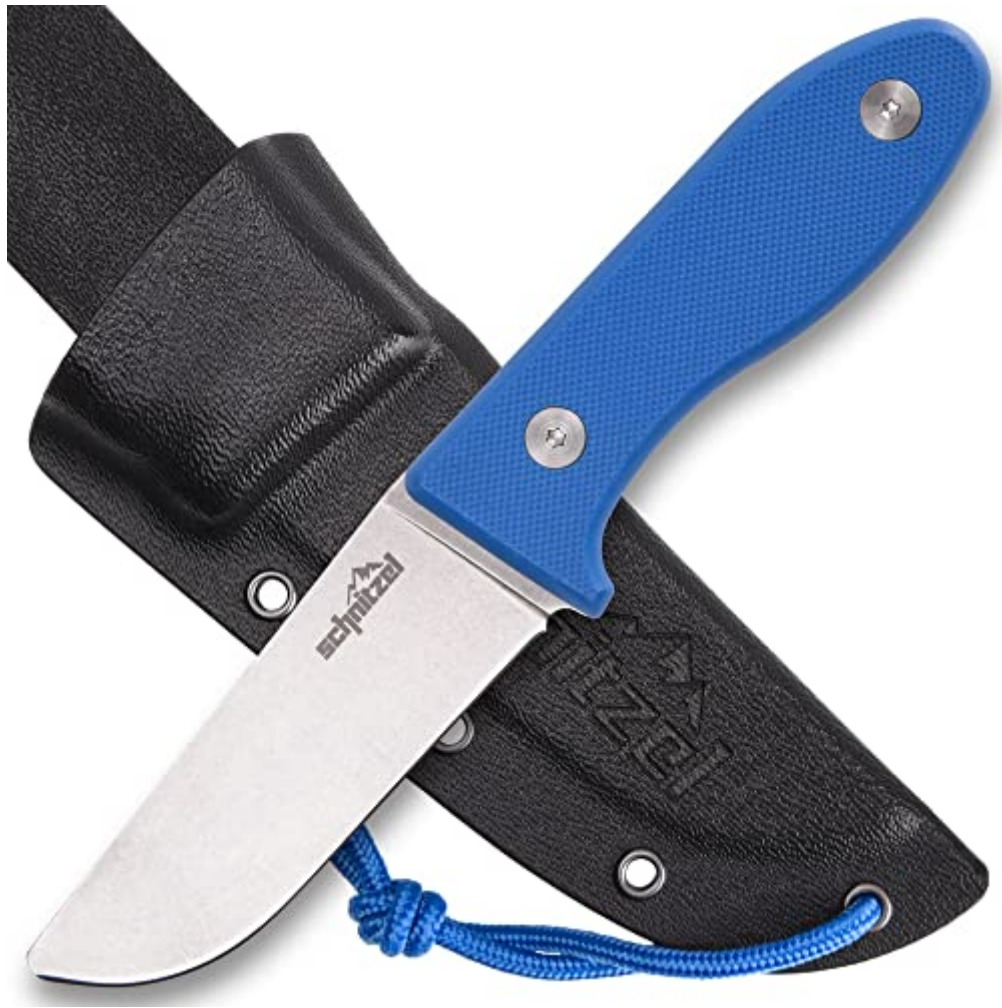
SCHNITZEL UNU, Kindermesser, Schnitzmesser und Outdoormesser für Kinder