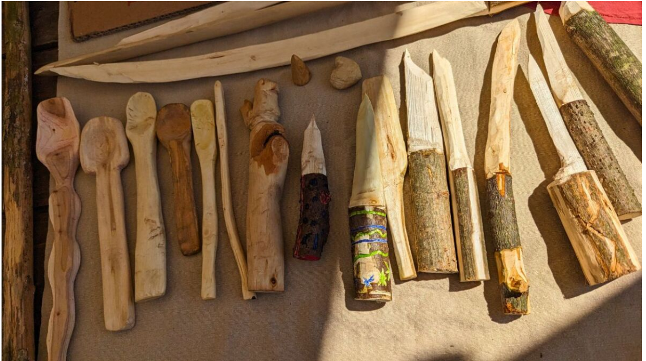
Hergestellte Löffel und Messer von Kindern

Ein passendes Schnitzmesser ermöglicht Kindern nicht nur, ihre kreativen Visionen zu verwirklichen, sondern lehrt sie auch, Verantwortung für ihre Werkzeuge und ihre Umgebung zu übernehmen.