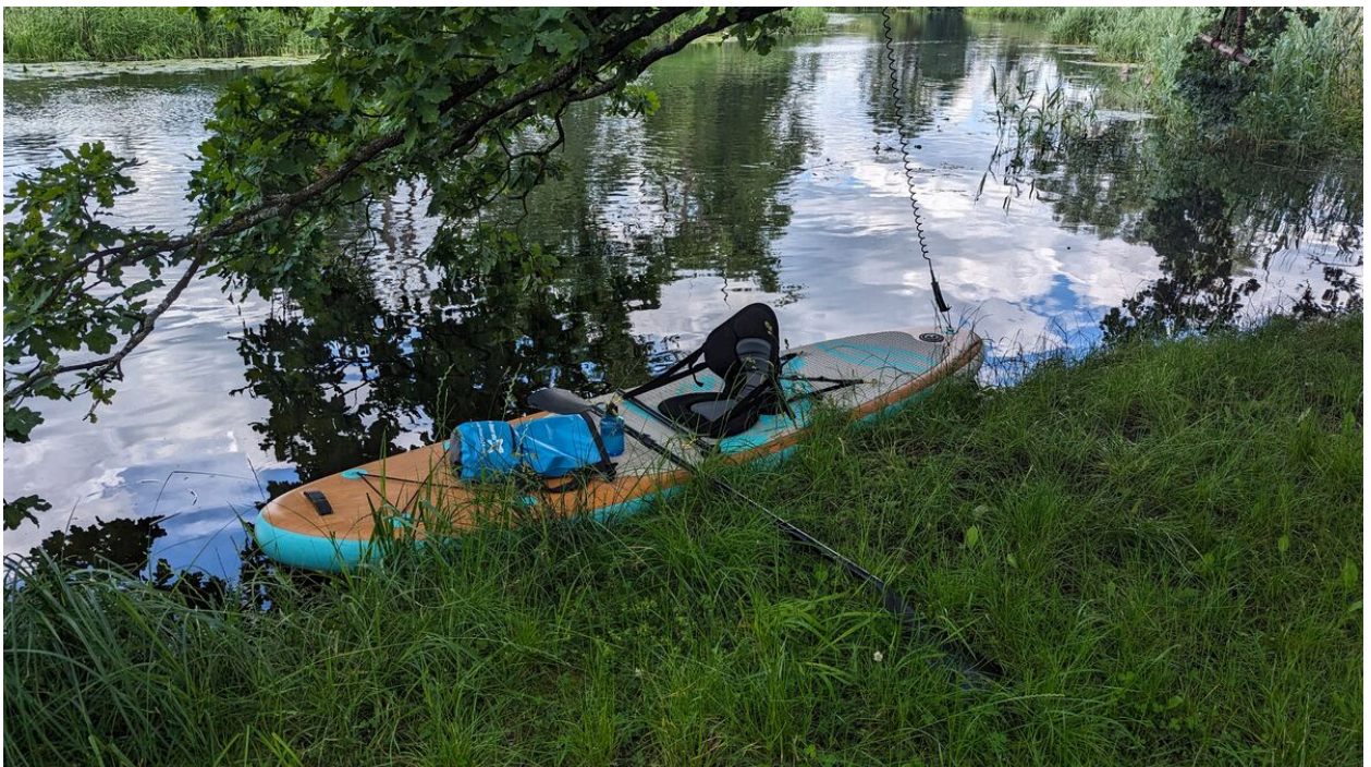
Das komplette UP-Boards24 Wooden Allround Board

Du bekommst ein hochwertiges, vielseitiges Board, das dich zuverlässig über jedes Gewässer trägt - und das nicht nur einmal, sondern viele Jahre lang.