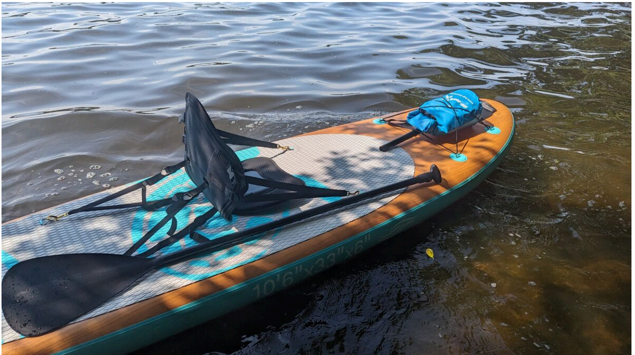
Das Board auf einem See

Selbst als ein Motorboot vorbei tuckert und kleine Wellen ans Ufer schickt, nimmt mein Board sie gelassen auf. Etwas Wackeln und das wars - einfach easy herumfahren.