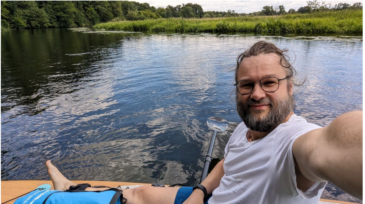
Ich beim Paddeln auf einem Spreearm in Brandenburg

Und was für ein Glück, dass ich nur 30 Minuten von meinem persönlichen SUP-Paradies entfernt wohne.