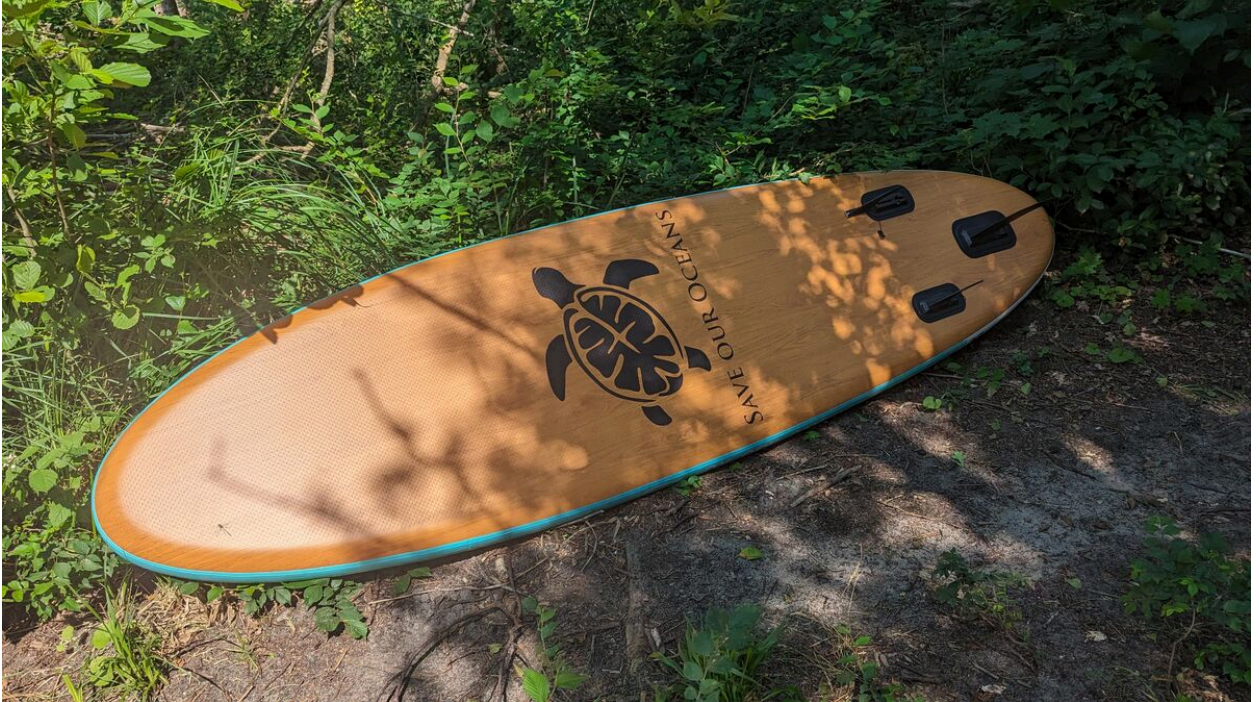
Das Board von unten mit der Holz-Optik und den Finnen

Mein erstes Fazit: Das SUP-Boards24 Wooden Allround Board ist den Kaufpreis wert. Eine Investition in dein SUP-Vergnügen, die sich garantiert auszahlt - und zwar nicht nur einmal, sondern bei jedem einzelnen Paddelschlag.