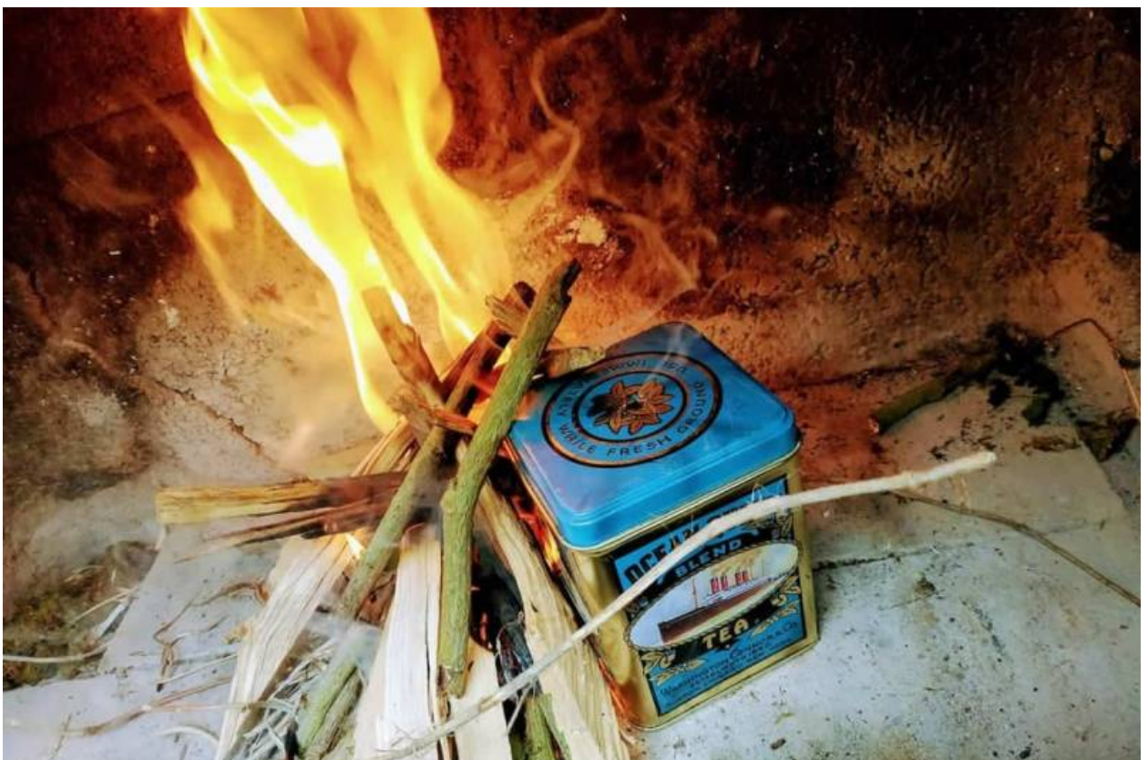
Feuer anzünden und Dose dort drin lassen