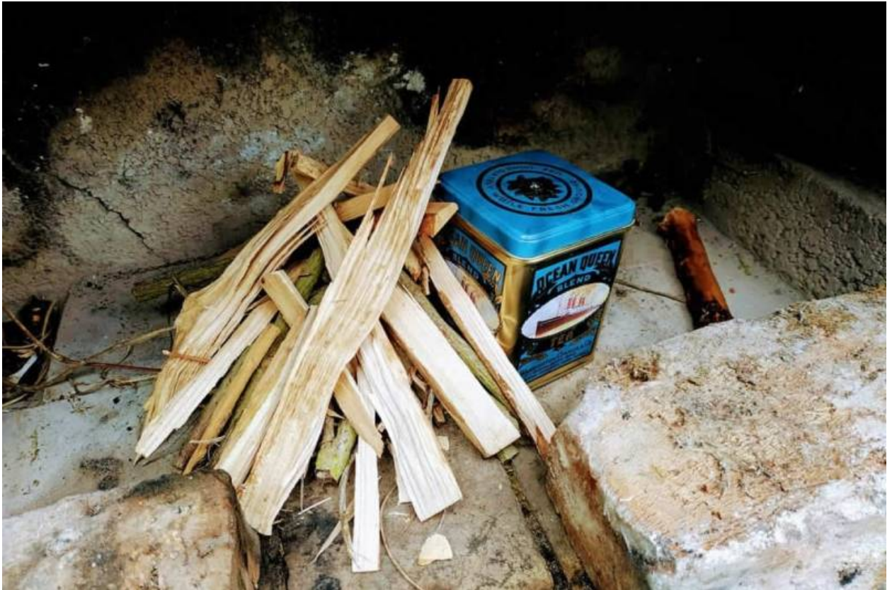
Dose ins Feuer stellen