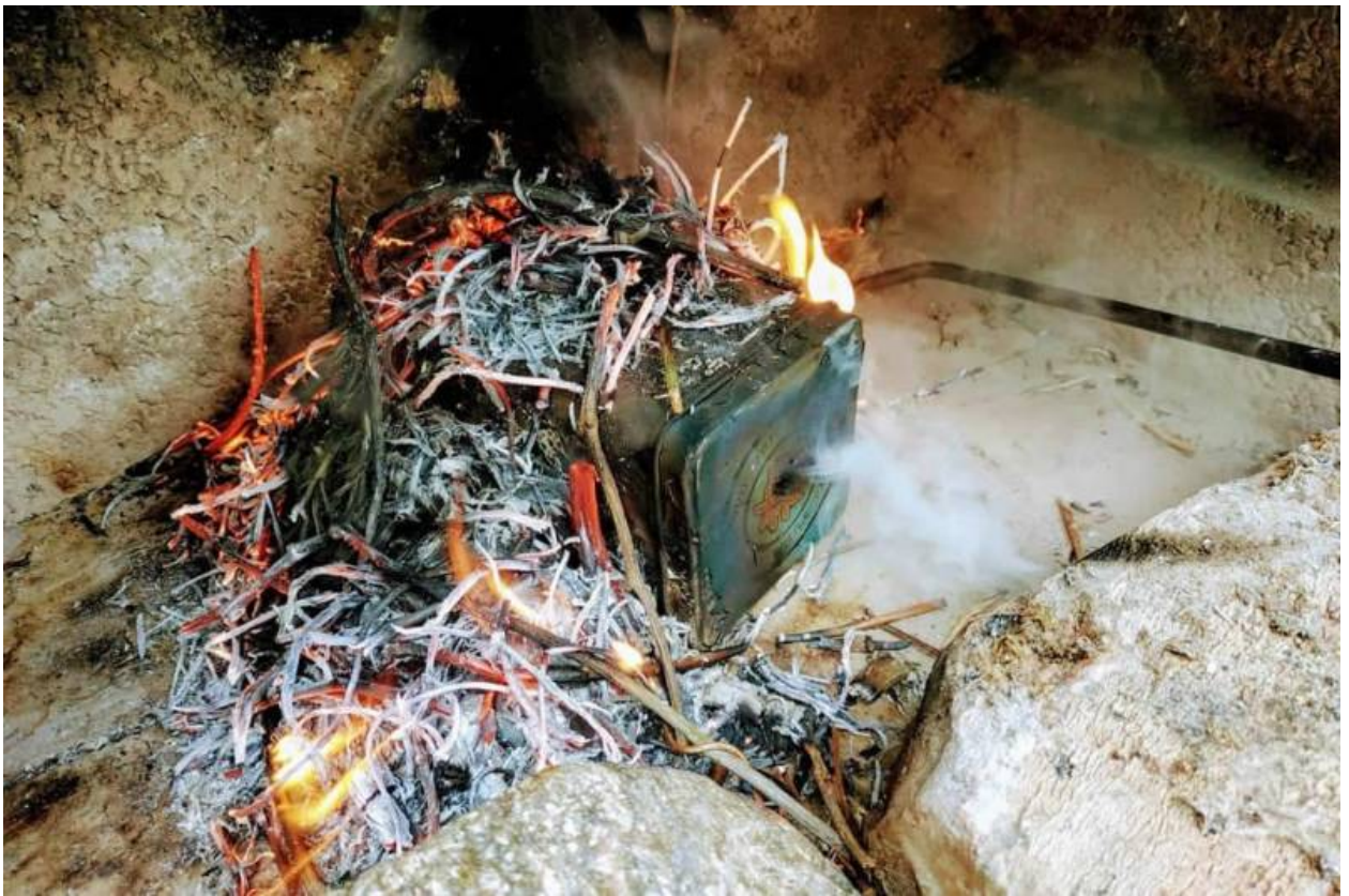
weißer Rauch entweicht aus der Dose

Profi-Tipp 1: Du hast eine runde Dose? Super, dann hör dir das an: Bohre das Loch in der Dose nicht oben in den Deckel, sondern in die Seite. Das macht jedoch nur Sinn, wenn sich das Metall vom Deckel und von der Dose beim Zuschrauben überlappen. Nun kannst du zwei Einstellungen der Dose vornehmen: einmal mit Loch zum Verkohlen (beide Löcher sind an der gleichen Position). Und einmal ohne Loch für den Transport. Um das Loch zu schließen, drehst du den Deckel so lange, bis das Außen-Loch sich nicht mehr mit dem Innen-Loch überlappt.